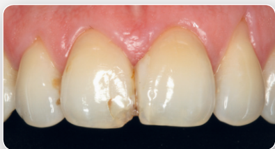
Wtórne zmiany próchnicowe, zq̄b 11.