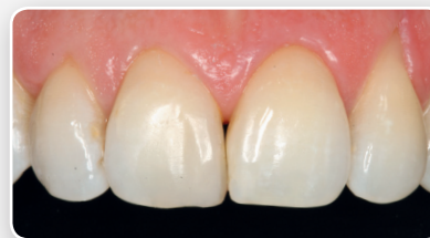
Ukończona odbudowa kompozytowa.